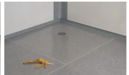
Duschwanne und Boden in einheitlicher Farbgestaltung