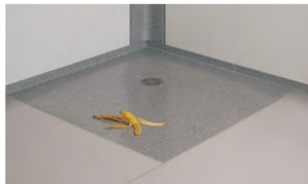
Duschwanne und Boden in unterschiedlicher Materialausführung

Unsere Innovation CRIFFIT® garantiert festen Halt auf Bodenflächen und in allen Duschwannen aus CREANIT®. Die Spezialbeschichtung ergänzt die Vorteile des WANDOVARIO®-Systems um einen weiteren Pluspunkt.