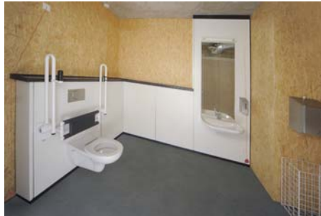
Raum 6 Behinderten WC