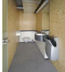
Raum 3 WC Damen