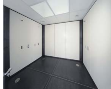
Raum 7 Duschanlage Herren