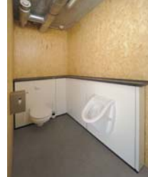
Raum 4 WC Herren