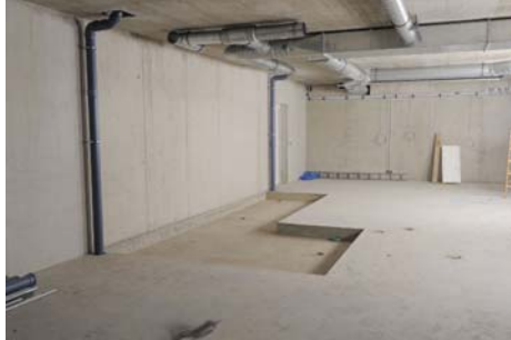
Anlieferung der Trockenbauwände

Im Bild zusehen die abgesengte Bodenplatte zur Aufnahme der Duschwannen.