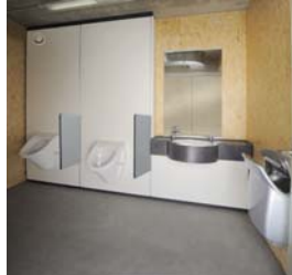
Raum 2 WC Herren