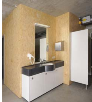
Umkleide Herren Waschtisch mit U-Schrank